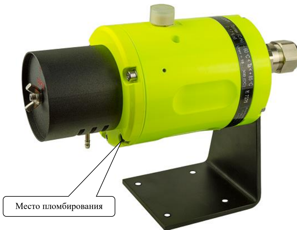
Рисунок 1 – Общий вид газоанализаторов стационарных оптических ГСО-Р1, датчик ГСО-Р1Д с трехцветным светодиодом (алюминиевый окрашенный корпус)