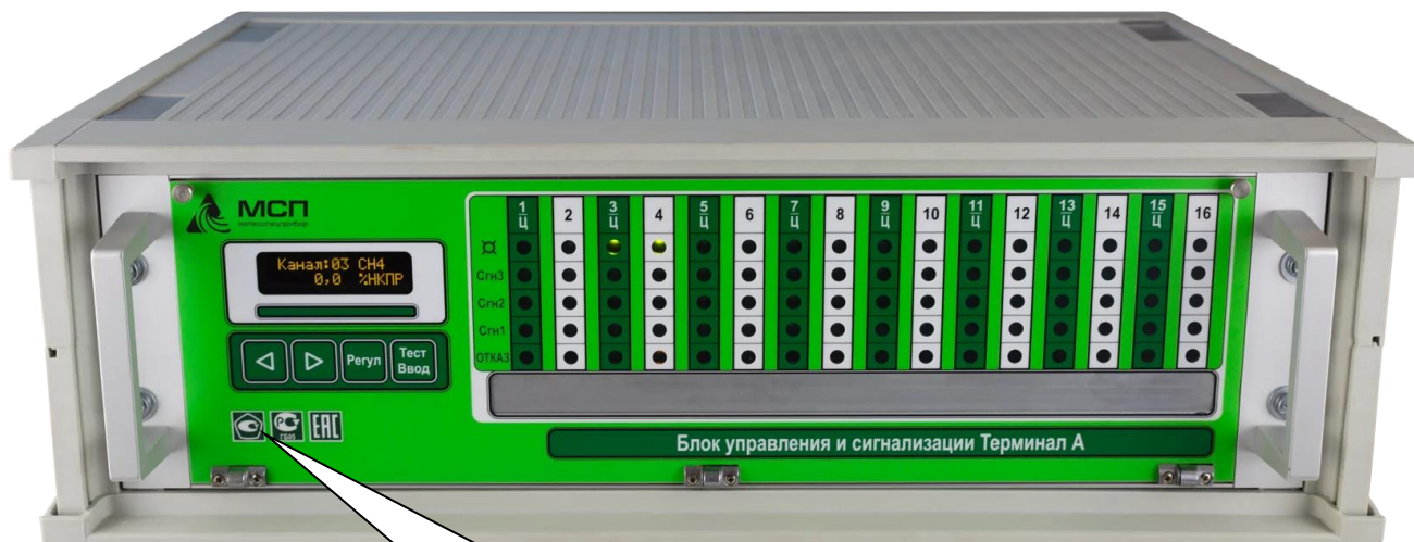
Знак утверждения типа