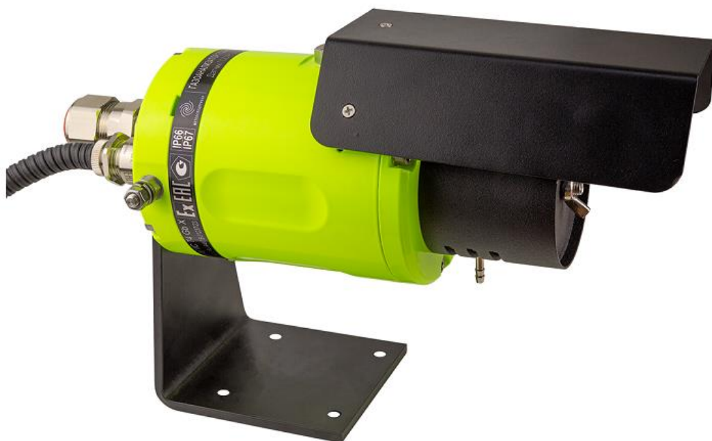
Рисунок 4 – Общий вид газоанализаторов стационарных оптических ГСО-Р1, датчик ГСО-Р1Д с козырьком