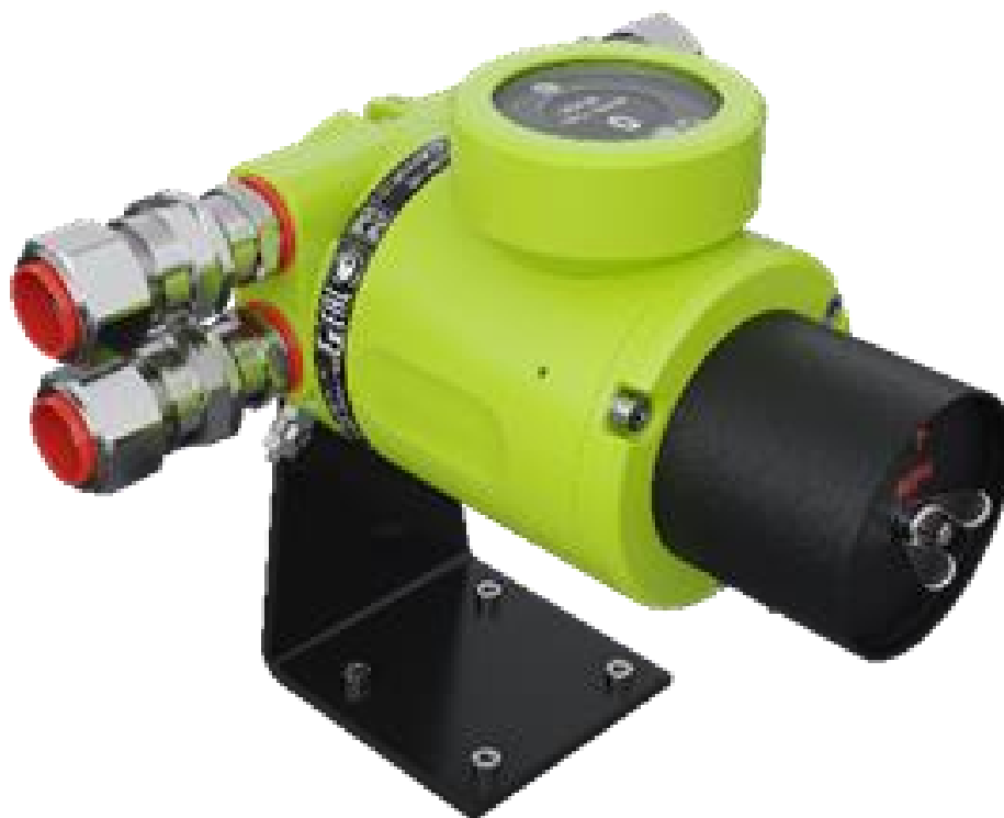
Рисунок 5 – Общий вид газоанализаторов стационарных оптических ГСО-Р1, датчик ГСО-Р1Д с подключенным через верхний разъем индикатором ГСО-Р1И