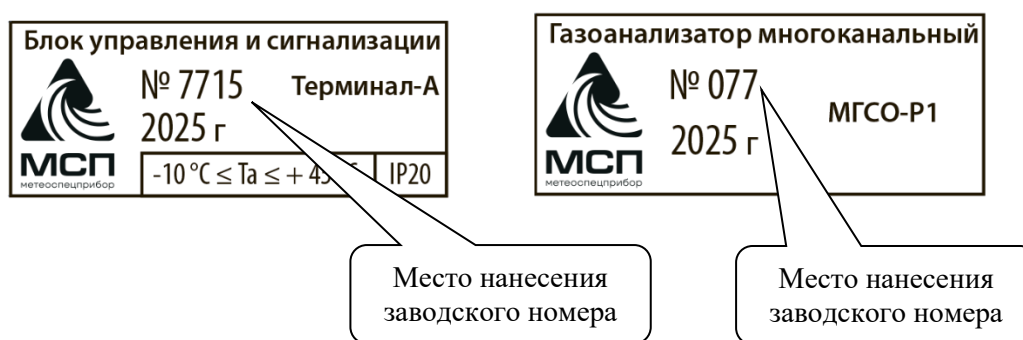
Рисунок 11 – Общий вид табличек, расположенных на левой боковой панели Терминала-А