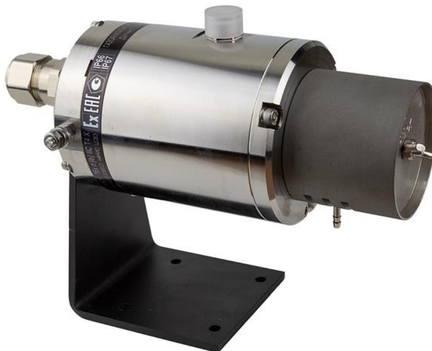
Рисунок 2 – Общий вид газоанализаторов стационарных оптических ГСО-Р1, датчик ГСО-Р1Д с трехцветным светодиодом, корпус из нержавеющей стали