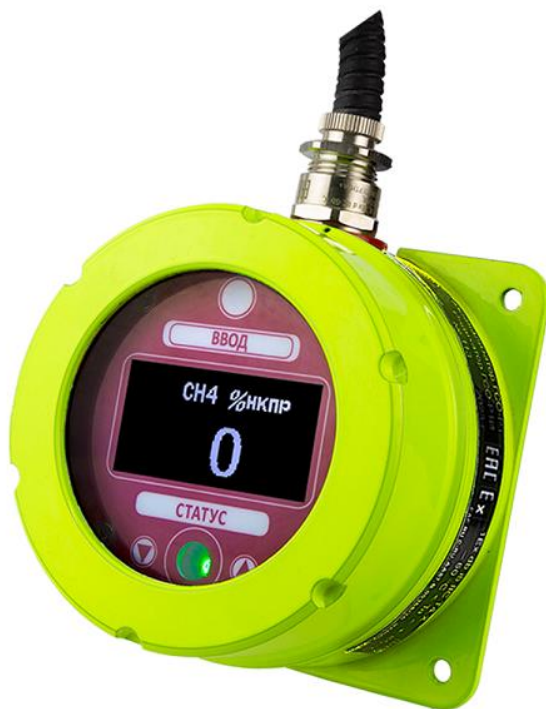
Рисунок 3 – Общий вид газоанализаторов стационарных оптических ГСО-Р1, индикатор ГСО-Р1И с соединительным кабелем (алюминиевый окрашенный корпус)